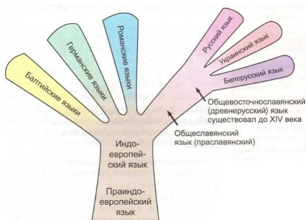
Рис. 1. Воображаемая схема происхождения языков из одного пра-языка

На всех этих географических территориях издревле существовало множество языков, вовсе не восходящих к какому-то выдуманному единому праязыку Рис. 1.