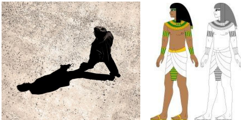
Рис. 3. Человек и его тень, двойник или душа КА (Египет)

СОЛО это вопрос СО ЛО? (совместно ли?), а САМ это сокращение СА+МНОЙ, т.е. с собой – ОБА МЫ. Человек считается не одним – за ним неотступно следует его тень. Древнее понимание тени как второго Я наглядно представлено на египетских изображениях Рис. 3 - 4.