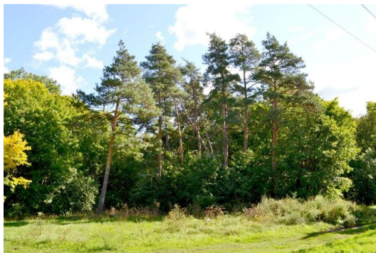
Рис. 2. Метафора рощи, более близкая к пониманию различия языков

В реальности языки не образуют такого урожая, они скорее похожи на рощу. В которой одновременно произрастают деревья разных пород, кустарник и разнотравье Рис. 2.